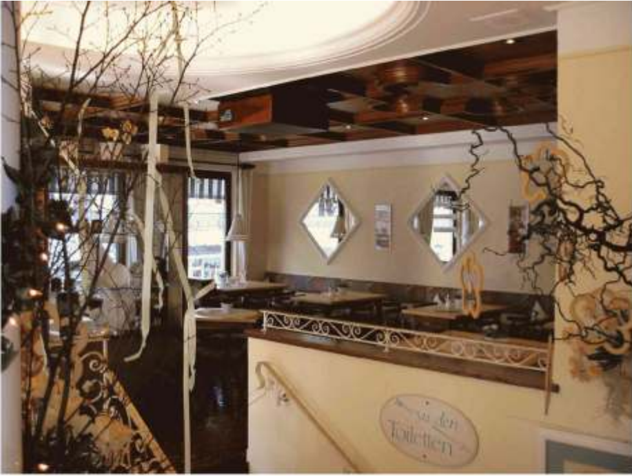
Café - Obergeschoss