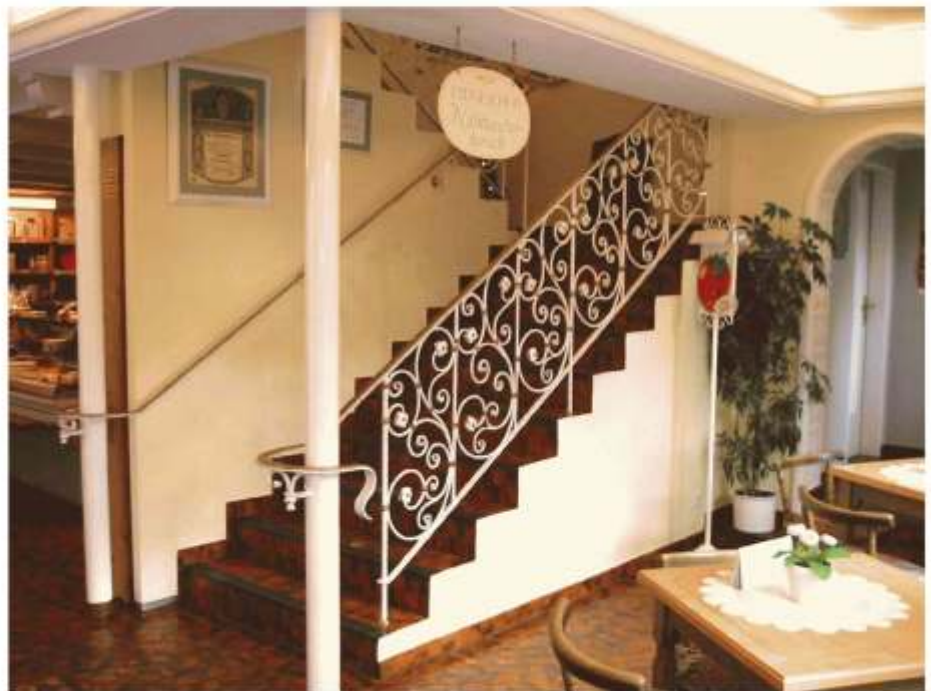
Café - Erdgeschoss Aufgang - Obergeschoss