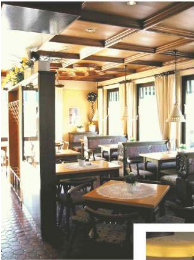
Café - Obergeschoss