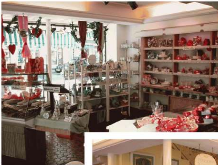
Konditorei - Laden